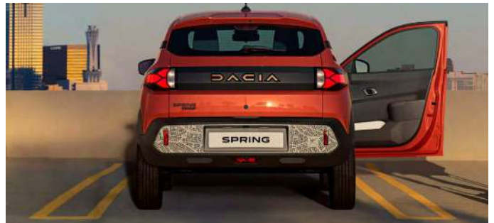
Dacia Spring 2024

Dacia destacó dos prototipos de vehículos. Por un lado, el Dacia Spring 2024 , vehículo eléctrico disponible con dos motorizaciones -45 CV y 65 CV-. Con unas dimensiones de 3,73 metros de largo, 1,58 de ancho y 1,52 de alto, su precio de venta rondará los 20.000 euros y, entre otros, los usuarios podrán dejarse llevar y disfrutar de numerosas características como un cuadro de instrumentos digital con una pantalla de 7 pulgadas.