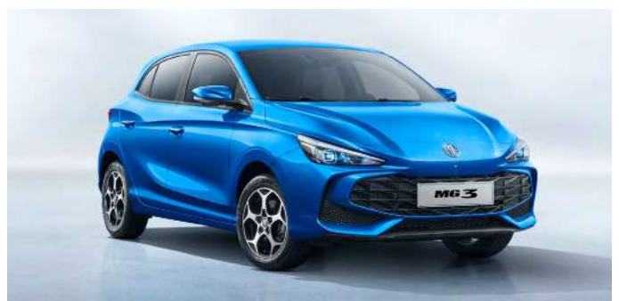
MG3 Hybrid 2024

Sin duda, las marcas asiáticas fueron las grandes protagonistas del último Salón Internacional del Automóvil de Ginebra y las que acapararon grandes miradas. Entre ellas, la firma china MG que confirmó la llegada al mercado europeo de su modelo MG7, deportiva y llamativa berlina de 4,8 metros de largo.