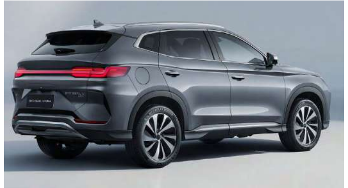
BYD Seal U DM-i

Este vehículo, con unas dimensiones de 4,77 metros de largo, 1,89 de ancho y 1,67 de alto, cuenta con una capacidad en su maletero de 552 litros. Además, dispone de un motor de gasolina de 131 CV y dos eléctricos -uno en el eje delantero de 204 CV y otro en el trasero, de 163 CV-.