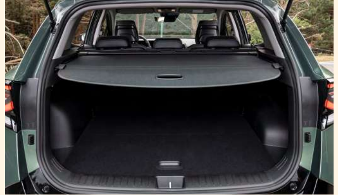
La capacidad del maletero ha aumentado sustancialmente con respecto al anterior Sportage.

El salpicadero premium, vanguardista y exento de elementos innecesarios, está diseñado con un enfoque indiscutible hacia el conductor, desde la pantalla curva integrada de última generación hasta el volante deportivo de cuero negro y la consola central con un selector de marchas. Los asientos del conductor y del acompañante combinan innovación y confort en un deportivo y estilizado diseño y, para maximizar la comodidad, el maletero permite ampliar el espacio de carga abatiendo los asientos traseros con solo tirar de una palanca.