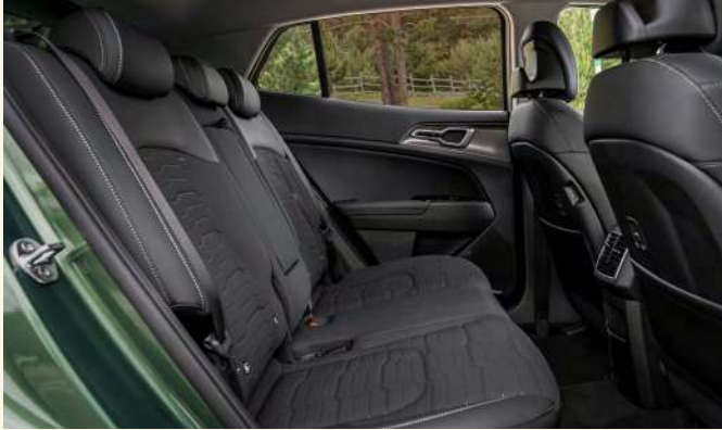
En todo el habitáculo se han utilizado materiales de la más alta calidad y agradables al tacto, mientras que las opciones de colores añaden vivacidad y energía.

El refinado habitáculo ofrece un espacio aumentado sustancialmente con respecto al anterior modelo, sobre todo para los pasajeros de la segunda fila, quienes pueden disfrutar de una notable cantidad de espacio para las piernas. En el caso del modelo híbrido, la batería está situada bajo los asientos de la segunda fila, lo que permite que el espacio para las piernas sea el mismo que el de los Sportage con motor de combustión. En el caso del híbrido enchufable, la batería de alta tensión se sitúa en el centro, entre los dos ejes y bajo la carrocería, lo que garantiza una distribución equilibrada del peso y un espacio interior práctico, cómodo y versátil.