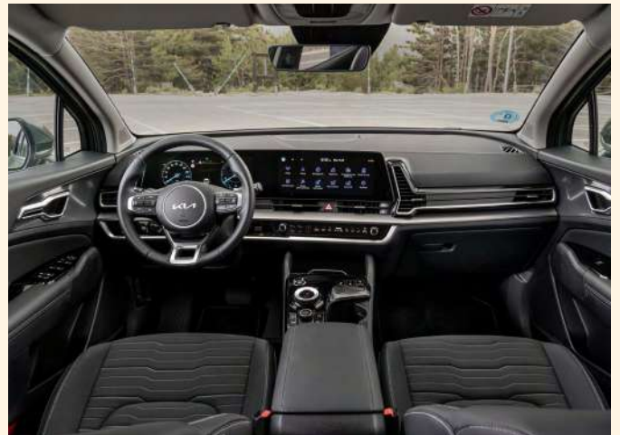
La consola central incluye una pantalla curvada, que se extiende por la zona frontal, lo que da al interior una anchura y profundidad espectaculares.

La tecnológica pantalla táctil de 12,3 pulgadas y el avanzado controlador integrado actúan como centro neurálgico para que conductor y pasajero controlen las funciones de conectividad, funcionalidad y usabilidad. Ambos sistemas han sido creados para ser fáciles de utilizar, muy intuitivos y suaves al tacto. El cuadro de instrumentos de 12,3 pulgadas está equipado con una pantalla de cristal líquido TFT de última generación, que genera unos gráficos increíblemente precisos y claros. Con una conectividad de alta tecnología tan avanzada y segura, el Sportage tiene la capacidad de recibir online los últimos mapas o actualizaciones de software. Además, un compartimento para Smartphones ofrece una carga inalámbrica de alta velocidad con 15 W.