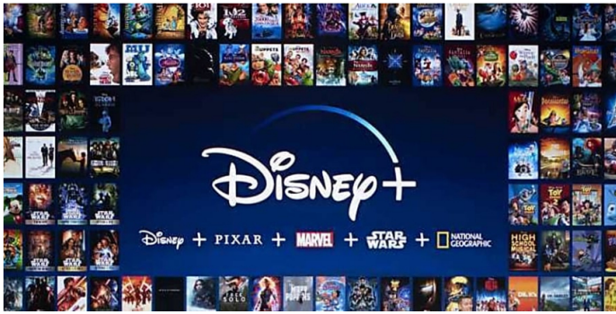
Disney + en prelanzamiento en España por tan solo € 59 para pocos días