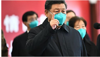
Un médico de Wuhan asegura que el Gobierno manipuló el balance del coronavirus para la visita de Xi