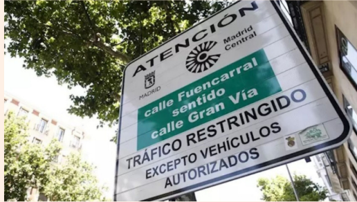
Cartel de Madrid Central.