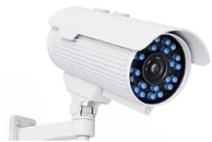
Todos los ladrones están asustados por este sistema económico de... Securitas Direct