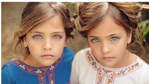
Las más hermosas gemelas en el mundo. ¡Espera a ver como son hoy en día! catytraveller