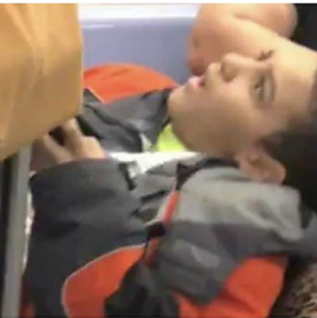
Un adolescente le niega el asiento a varios pasajeros del metro para ir recostado, y recibe la lección de su vida Drivepedia