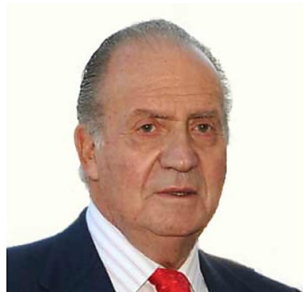
¡No te lo vas a creer! Aquí tienes la colección de coches de Juan Carlos de Borbón Extramotor.com