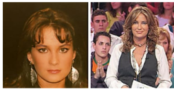
¿Qué fue de la presentadora de 'El Diario de Patricia'? No creerás a qu... Ninja Journalist