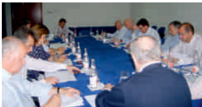
Jornadas de trabajo de la junta directiva de FENEVAL

El programa de trabajo reservó un lugar especial para debatir la problemática de cada una de las asociaciones provinciales y escu-