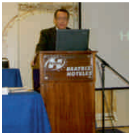
Intervención del patrocinador de la empresa Crafol