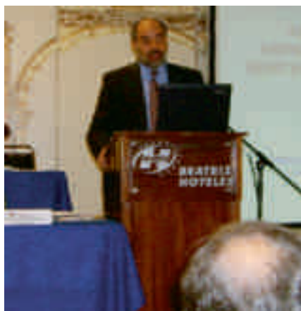
Intervención del patrocinador de la empresa Diagonal